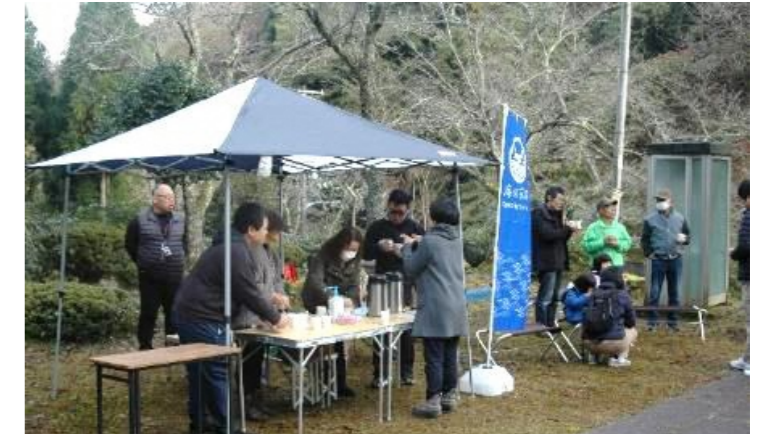
市観光公社大宮町支部の皆様によるふるまい