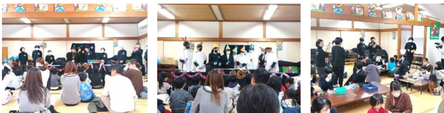
ハロウィンのみなさま

12月2日(土)午後、口大野地区公民館にて開催。当日は、ハロウィン会員による読み聞かせや人形劇のほか、大宮中学校ボランティア・パソコン部の皆様によるハンドベルの演奏、かんたんスノーボール作りなど、40周年にふさわしいふゆのお楽しみ会となりました。