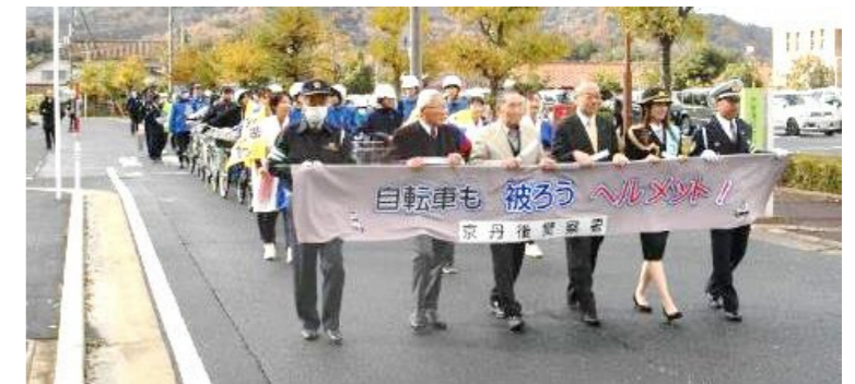
「自転車も被ろうヘルメット!」の横断幕を先頭にパレード