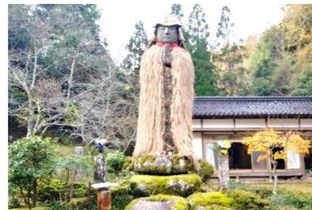
府下最大級の平地地蔵は京丹後市指定文化財

11月23日(木・祝)午前、4人の世話役により平地地蔵(上常吉)に蓑(みの)を着せる作業が行われ、法要が行われました。当日は、京丹後市観光公社大宮町支部によるぜんざいとコーヒーのふるまいが行われ、肌寒い小雨の中、お参りに来られた方々の心と体を温めました。