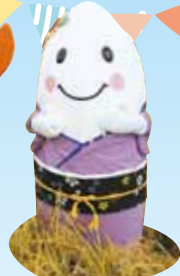
まめっこまいちゃん(与謝野町)