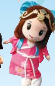
いづみ姫(木津川市)