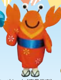
コペちゃん(京丹後市)