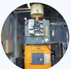
木質チップボイラー+温泉施設 (京丹後市)