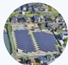
市民太陽光発電所 (京丹後市)