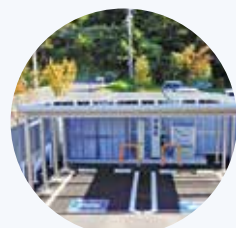
太陽光発電+電気自動車充電設備 (京丹後市)