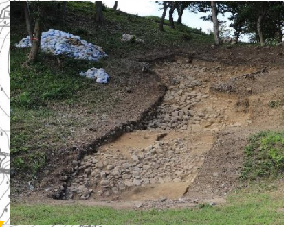
平成 30 年度 2 トレンチ