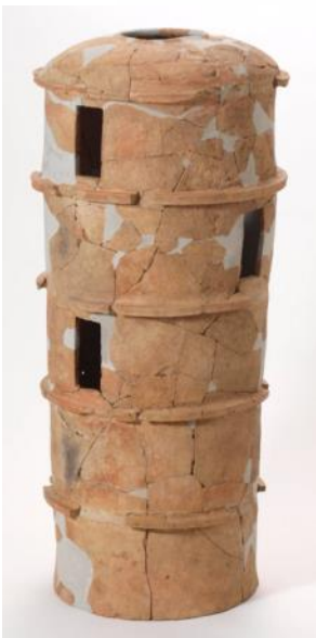
丹後型円筒埴輪 平成 20 年度 4 トレンチ 出土