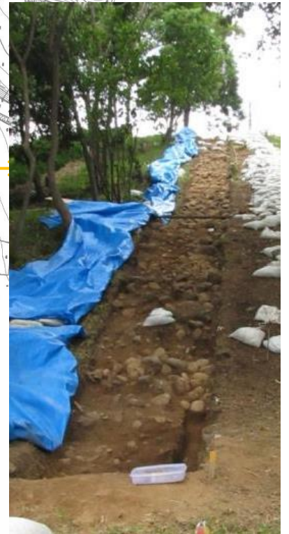
平成 30 年度 1 トレンチ