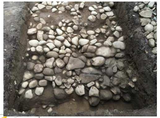
平成 29 年度 3 トレンチ