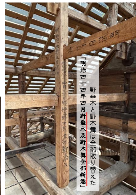
「明治四十四年四月野垂木及野木舞全部新添」 野垂木と野木舞は全部取り替えた