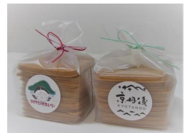
かがやきの杜せんべい