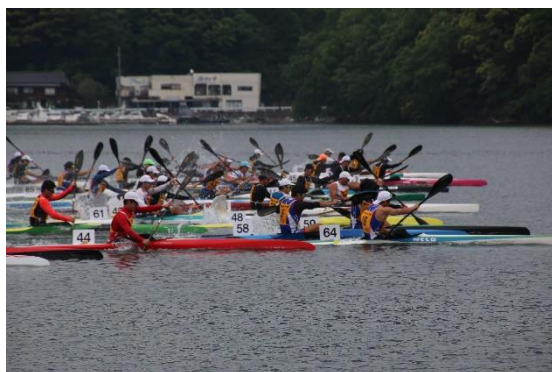
（令和 4 年度大会の様子）

●時 間 13 日（土） 14 日（日） シングル種目 8 時 00 分～ ペア種目 8 時 00 分～