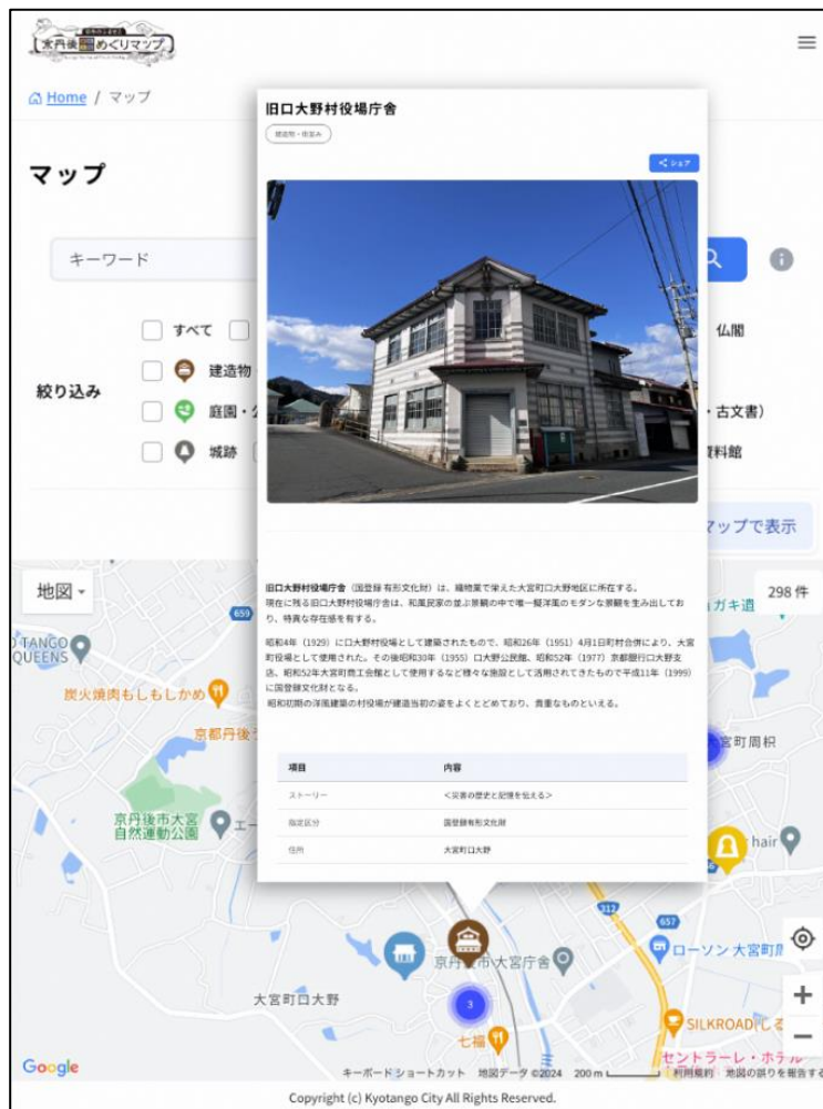
(マップイメージ画像)

丹後半島における多彩な交流・交易、人々の暮らしが生み出した歴史文化や文化財を京丹後市の煌めく魅力としての「光」と捉え、「光」を未来につなぐ誇りあるまちづくりを行政、市民、文化財所有者、観光・商工関係団体、専門家などが協働して進めるための計画です。