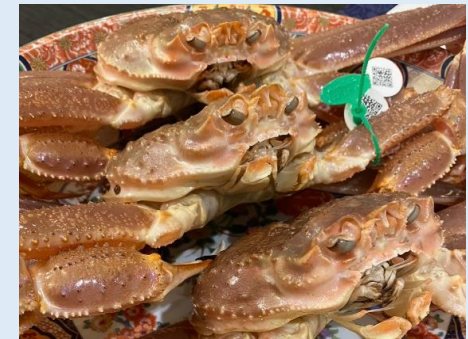
地域ブランド「間人ガニ」