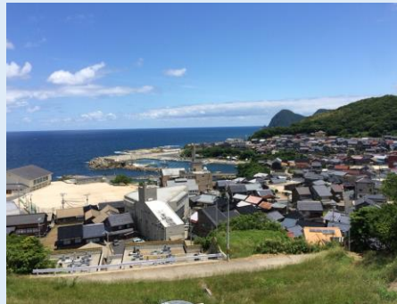
地域資源を活かした人材育成