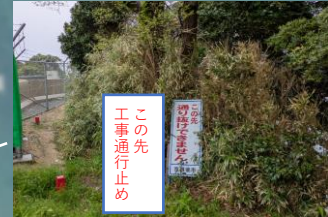
(規制看板 (イメージ))