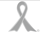
オレンジリボンは、子ども虐待防止のシンボルマークです!