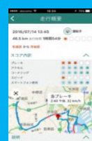
安全運転のヒント