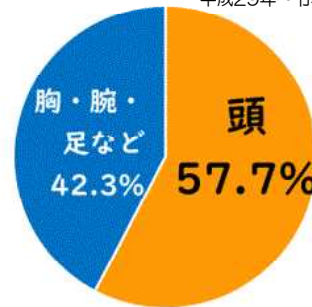
自転車乗車中死者の人身損傷主部位 平成29年~令和3年合計

自転車で亡くなられた人の 半数以上が頭部に致命傷 を負っており、ヘルメット非着用時の致死率は着用時と比べ 約2.5倍 と高くなります。