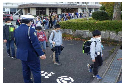
【11月4日(水)大宮南小学校にて】