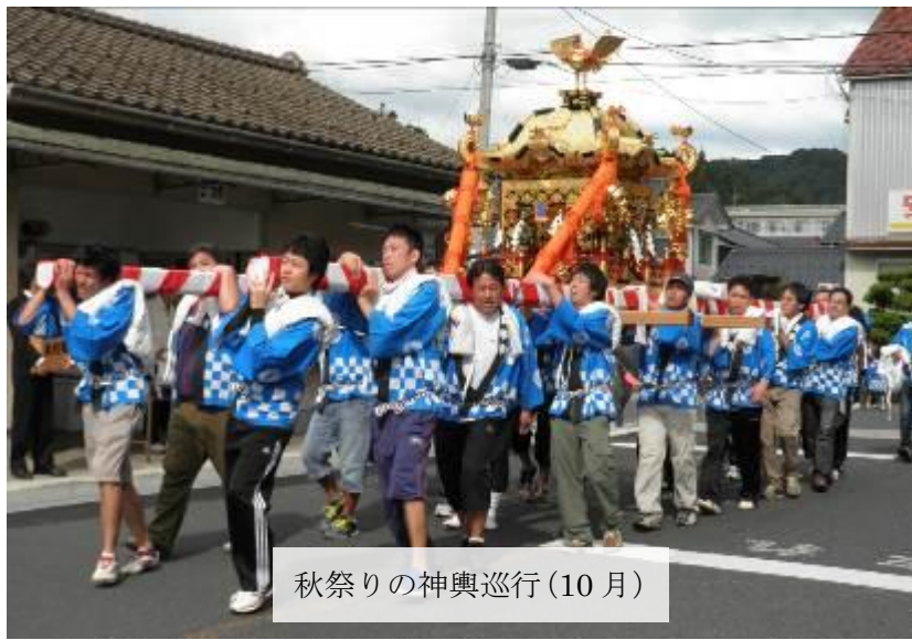
秋祭りの神輿巡行(10月)