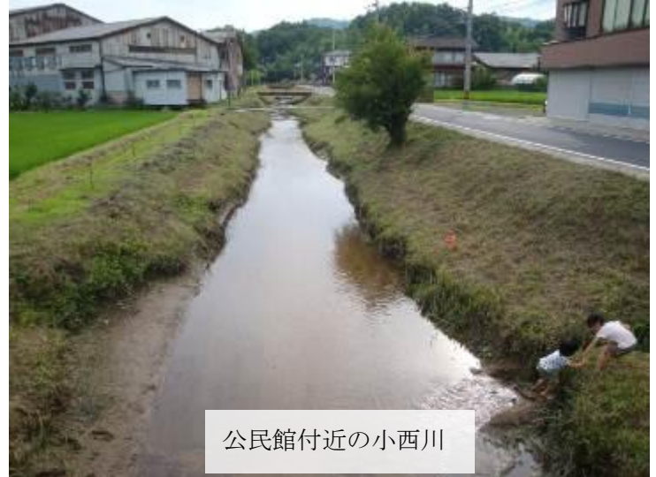
公民館付近の小西川

安区も他地区と同様に高齢化が進んでおり、75歳以上の割合は23%、65歳以上では38%にのぼっています。そして年々増加の傾向にありますが、皆さんとてもお元気です。写真は区と福祉委員会の共催で行っている「安区ふれあいの集い」の1コマです。昨年も久美浜温泉に行き、みんなと一緒においしい料理に舌鼓を打ちながら語り合い、またアトラクションやカラオケに楽しい一日を過ごしました。