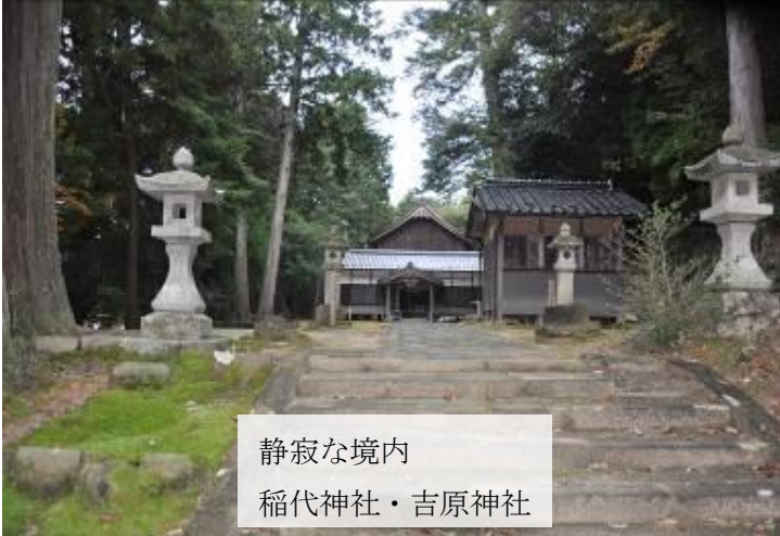
静寂な境内 稲代神社・吉原神社

大切にしよう！ 小西川 今年も小西川河川敷の草刈りを実施し、見違えるようになりになりました。小西川は安地区の中心を流れて農業用水として、今でも区民の生活の中心にあり安らぎと憩いの場となっています。昔は初夏に