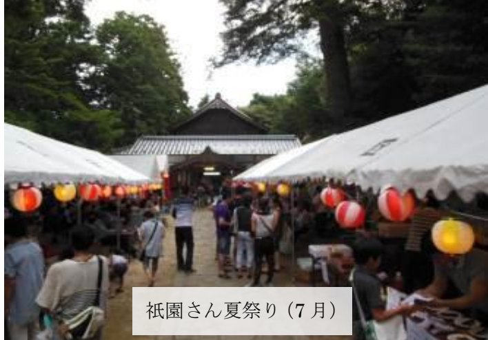
祇園さん夏祭り(7月)

安区の秋祭りはお神輿でにぎわいます。稲代神社で早朝の内に神事を済ませ、のろしの打ち上げを合図にお宮を出発します。振れ太鼓を先頭にしてまず子供神輿が続き、そのあとから大人神輿を威勢よく担いで区内をくまなく練り歩きます。行く先々で沿道からの声援をいただき、途中数か所で休憩しながら、出発してからお宮に戻るまで約4時間の巡行です。