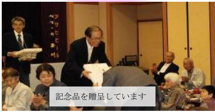
記念品を贈呈しています

安区も他地区と同様に高齢化が進んでおり、75歳以上の割合は23%、65歳以上では38%にのぼっています。そして年々増加の傾向にありますが、皆さんとてもお元気です。写真は区と福祉委員会の共催で行っている「安区ふれあいの集い」の1コマです。昨年も久美浜温泉に行き、みんなと一緒においしい料理に舌鼓を打ちながら語り合い、またアトラクションやカラオケに楽しい一日を過ごしました。