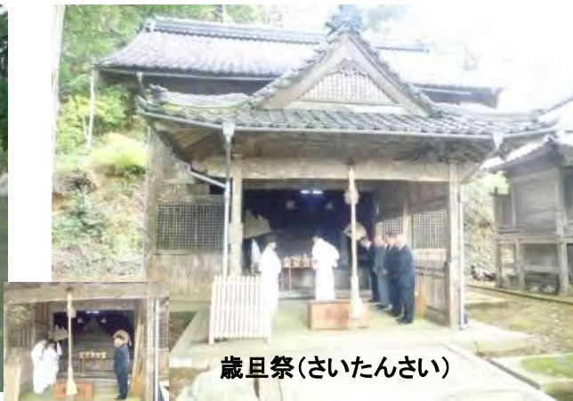
歳旦祭(さいたんさい)