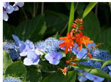
ガクアジサイ(額紫陽花)とキンギョソウ(金魚草)