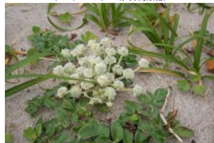
ハマボウフウ(浜防風)