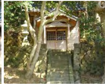
車野にある 三柱(みはしら)神社