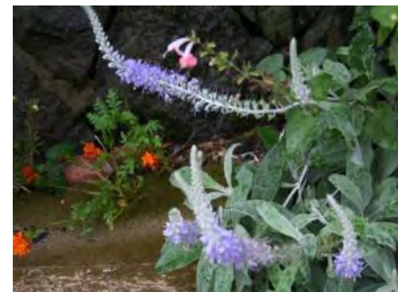
トウテイラン(洞庭藍)