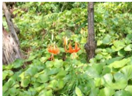
コオニユリ(小鬼百合)