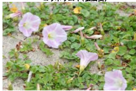
ハマヒルガオ(浜屋顔)