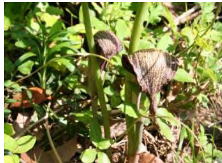
ウラシマソウ(浦島草)