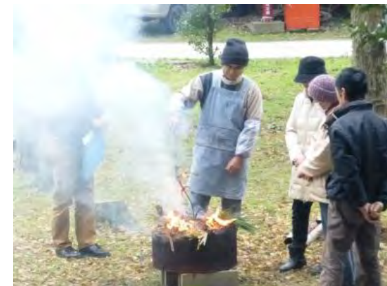
どんど焼き (左義長) 平成27年1月11日(日)9:00より六神社境内にて、「どんど焼き」が区民の無病息災を願い区役員も参加して行われました。