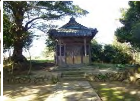
八柱(やはしら)神社 素盞鳴命(すさのうのみこと)を祭る

高嶋地蔵の言われは、大昔、後宇多院天皇の勅願寺であった與謝郡日置村にある金剛心院を復興した忍性律師(位の高い僧)は天皇の命令を受け、大阪の四天王寺を管理することとなり、併せて金剛心院をかけもつこととなった。律師は正安三年(1301年)に四天王寺に大きな石華碑を建てた。律師の死後、その弟子である順慶上人が奈良の大安寺より金剛心院にやってきた。そして石華碑の残った石を使い地蔵様を彫刻し、嘉歴三年(1328年)に、勅使(天皇の使い)の宿の寺があった日置村の高石寺に安置しようと大阪から海で輸送している途中、高島海岸沖で嵐に遭い海底に沈んでしまったが、翌年元徳二年に高嶋海岸に打ち上げられたのを上野区民の願いによって高嶋巖上に安置した。これが高嶋地蔵様である。安置されている年月日は、元徳二年から昭和七年までで六〇三年になる。高嶋に地蔵様が安置された後、高石寺には高嶋地蔵様と同型の地蔵様を彫刻して嘉歴四年六月二十四日口口坊と銘記し安置されたものが現在の高石地蔵様である。なお、地蔵様は臺座の蓮(ハス)の花の模様から鎌倉末期のものといわれており高嶋地蔵尊と高石地蔵尊は順慶上人の祈願彫刻の姉妹作といわれるようになった。(高嶋地蔵尊の由来・上野区福祉委員会資料より)