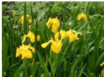
キハナショウブ(黄花菖蒲)