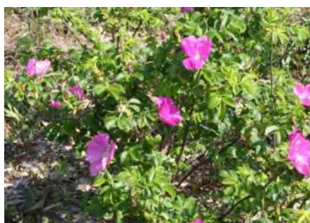
ハマナス(浜茄子)の群落