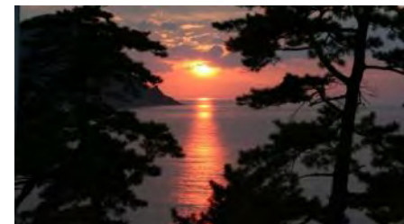
駐車場からの夕日

夏本番を迎え区民全体で、万全の態勢で観光客、海水浴客の皆様のお迎えにたくに取りかかっている 高嶋海水浴場 と オートキャンプ場 です。広々とした砂浜。澄切った海。