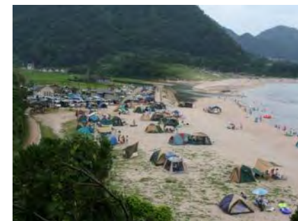
オートキャンプ場全景