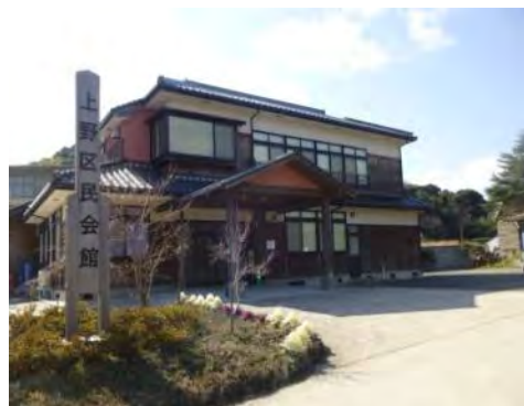
上野区民会館は地区の要です。

昭和30年には、61世帯、272人が生活していました。現在は、 農業 (稲作)と 観光 に力を入れて地域の活力再生に頑張っている。