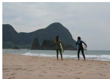
サーファーポイント

よもぎが丘に立つ旧宇川中学校。多くの著名人をこの世に送り出してきましたが、平成26年の学校再配置(丹後中学校)により閉校となりました。