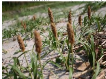
コウボウムギ(弘法麦)