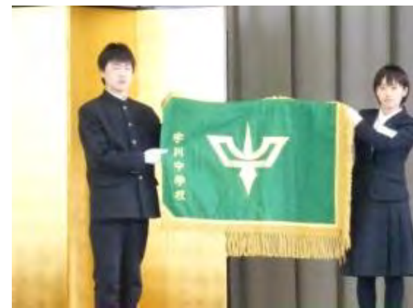
宇川中学校閉校式