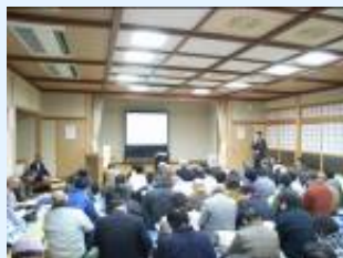
地域づくり講演会を開催 女性・若者なども参加