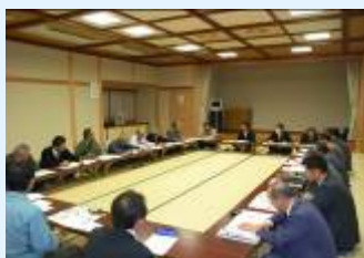
14集落がオール宇川の取り組みを開始