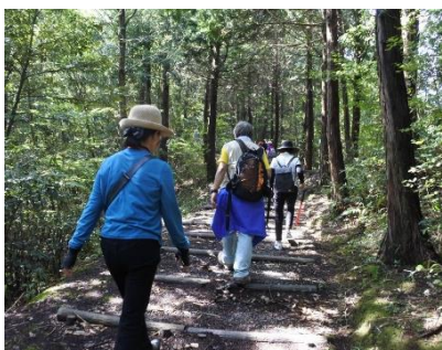
こまねこウォークの様子

また、金刀比羅神社では、手づくり市開催のほか、社務所内では、「コロナ禍でのおもてなしを考えるちりめん茶室のしつらえ展」や、丹後ちりめん創業300年を記念した資料の展示が行われました。かわいらしい猫の置物がずらりと並ぶ「猫の目展」なども併せて開催され、見て楽しい、体験して楽しい4日間となりました。