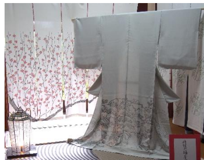
ちりめん創業300年記念展