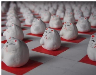
一匹ずつ表情が異なる猫の目展