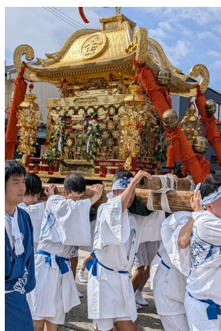
金刀比羅神社の神輿