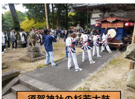
須賀神社の杉若太鼓