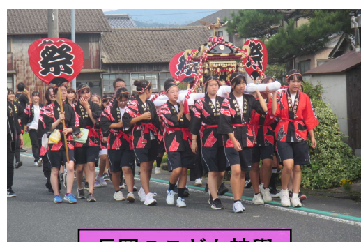
長岡のこども神輿