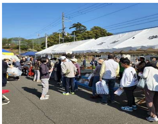
今春開催された「五箇朝市」の様子 各ブースに行列ができていました