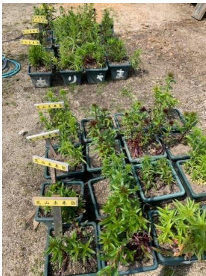
種の発芽が・・・？ ちょっと心配！

また、今年は農地・水向上委員会の依頼を受け、庵寺橋から府道に向かう交差点の畑にひまわりやコスモスなどの花を植えてみました。初から秋に向けてどんな花畑になるのか、夏か楽しみです。