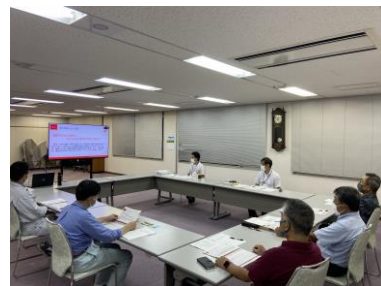
↑検討委員会の様子