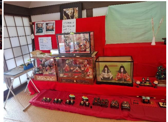
会場いっぱいに展示されたひな人形の様子

2月1日(日)から3月1日(日)まで小町公園内の小町の舎(大宮町五十河)を会場に第9回ひな人形展が開催されました。