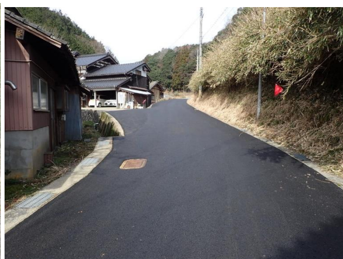
市道天神神社線舗装修繕（下常吉） 着工前（左）と完成（右）

編集後記 ここ数年、毎月発行していた「おおみやトピックス」ですが、先月、久しぶりに休みをいただきました。これではいけないと、今月号は久しぶりに4ページバージョンで作成しました。3月7日は丹後震災の日ということで、午後6時27分にはサイレンの吹鳴がありました。毎年、この日は、いつ発生するかわからない災害に対する備えを振り返る機会としています。この日にあわせ、京丹後市防災アプリの配信が始まりましたのでぜひともお使いください。