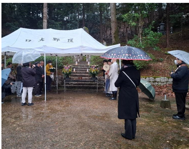
供養塔の前での法要のようす

3月7日(土)午後4時～ 常德寺(口大野)にて丹後大震災第100年遠忌追悼法要が行われました。常德寺では、毎年、3月7日に法要を行われています。今年は100年遠忌追悼法要として、法要のほか、供養塔前にて区内関係者による献花、折鶴の奉納、区長から追悼がありました。