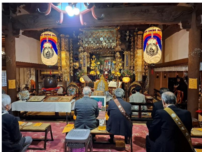
本堂での法要のようす