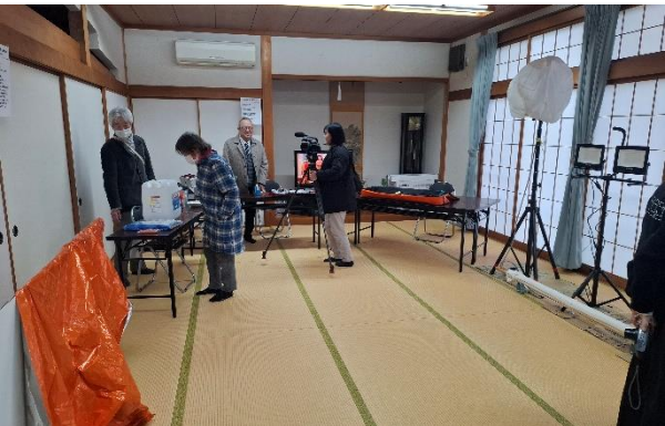
口大野図書館ハロウィンによる防災紙芝居（上） 震災当時の新聞や写真の展示（左上） 防災用品の展示（左下）

3月7日(土)午後1時～ 口大野地区公民館にて震災100回忌事業が行われました。震災の直後に発行された新聞や、当時の被害状況がよくわかる写真パネルの展示と解説のほか、口大野図書館ハロウィンによる防災紙芝居、防災用品の展示などが行われました。