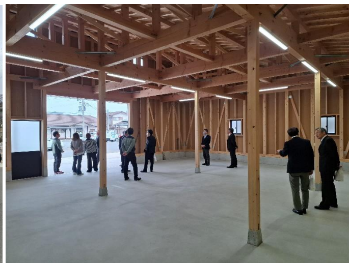
完成した河辺区防災倉庫（竣工式のあとの内覧のようす）

2月23日(月・祝)午前9時～ 河辺区民センターにて河辺区防災倉庫の竣工式が行われ、式典終了後に関係者による内覧が行われました。河辺区では昨年7月に「河辺地区防災計画書」が地区防災計画として承認されています。防災倉庫の建設は、区民センターとあわせハード面の拠点として整備されたものです。