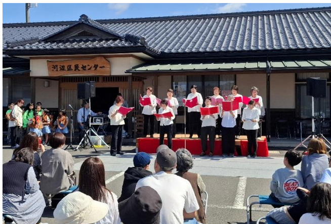
河辺区桜まつり(河辺:4月11日)