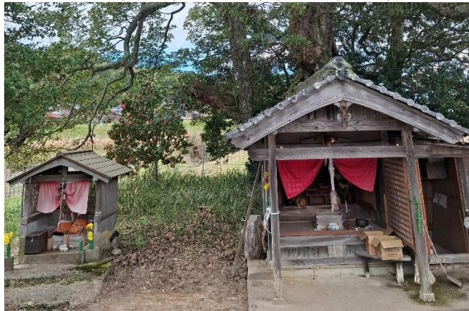
薬師祭(奥大野:4月5日)