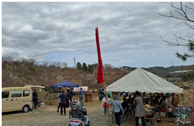
倉垣桜公園祭り(奥大野:4月5日)