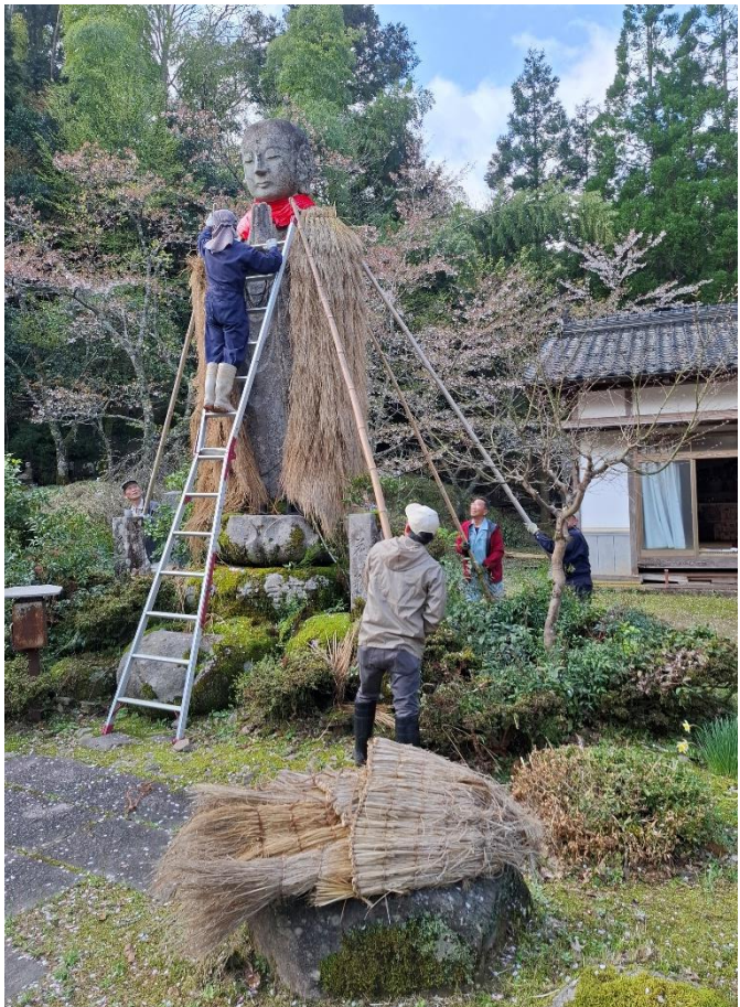
平地地藏 みのをはずす作業(上常吉:4月11日)