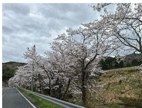
4月上旬の桜 (左上)大宮中学校 (上中)延利 (左下)奥大野 (下中)谷内 (右上)平地地蔵(上常吉)