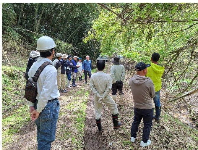
大谷での生活についてお話をお聞きする