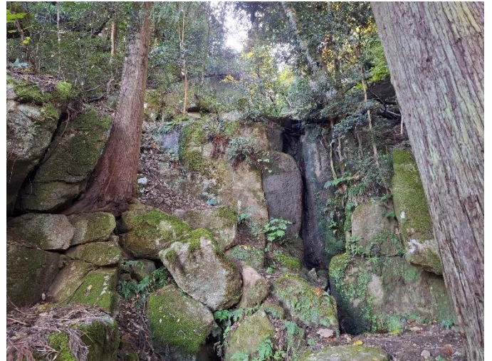
岩屋寺奥の院 白糸の滝(降竜の滝)