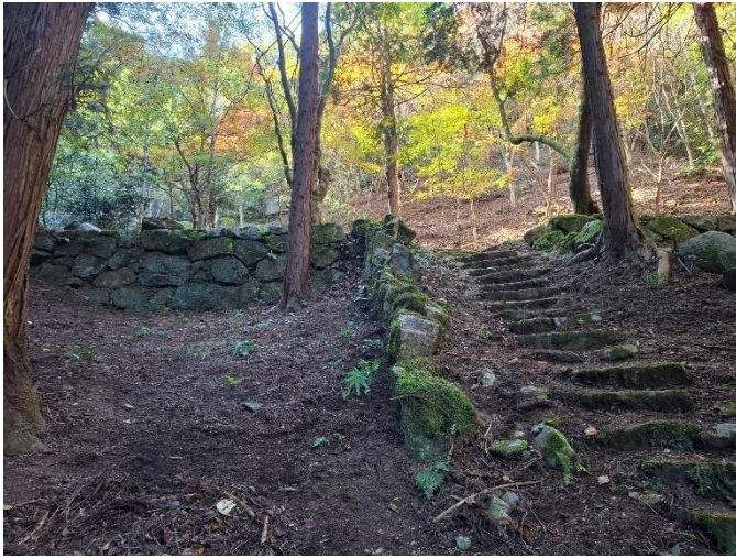
岩屋寺奥の院 山門跡と伝える場所