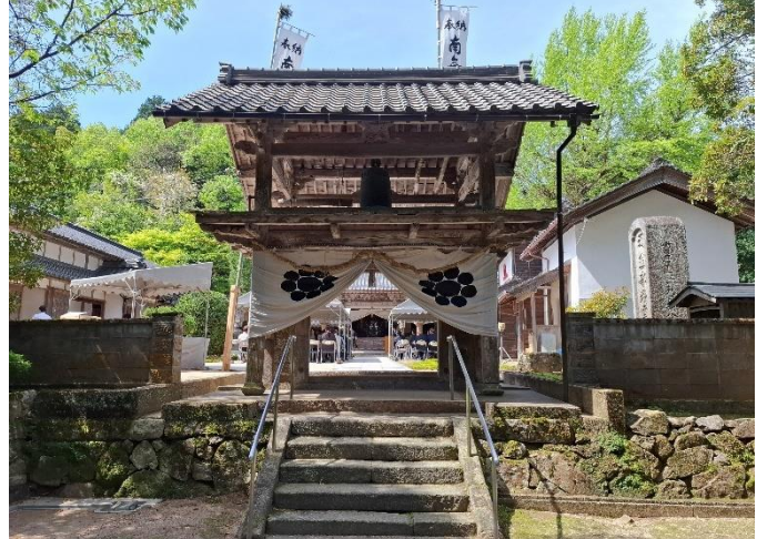
岩屋寺山門(江戸時代後期の建物)