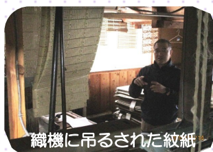
織機に吊るされた紋紙

平成31年4月14日（日）、雨が降りしきる中「第69回京丹後ちりめん祭」が開催されました。網野神社境内を主な会場に行われた多彩な催しの中で、「作り手とつながる工房めぐり」と題し、丹後ちりめん白生地製造工場の見学が行われました。