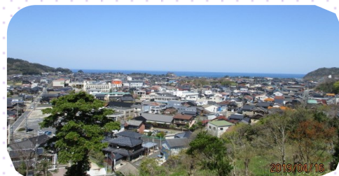
後円部から日本海を望む

網野銚子山古墳は、およそ1600年前の築造と推定される全長198mの日本海側最大級の前方後円墳で、大正11年に国史跡に指定されました。