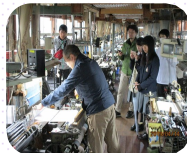
工場を見学する参加者

参加した地元の高校生は、「地元のことをあまり知らないのでもっと知りたくて参加しました。」と語り、織物によって生糸の産地を上手に使分けるといった説明に熱心に聞き入っていました。