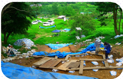
墳丘上部からみる発掘調査の様子

【現地説明会のご案内】 ◎日程：令和元年9月8日(日) 13:30~ ※現地は駐車場がありません。 旧Aコープあみの跡駐車場に13:15までに集合・現地まで車で送迎があります。 ◎問合せ先：文化財保護課 ☎ 69-0640