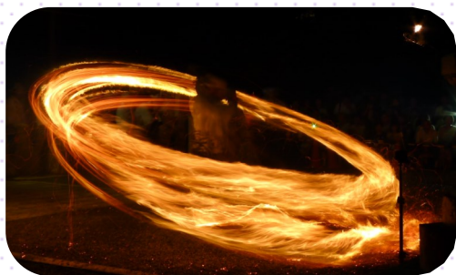
勢いよく回転するマンドリ

当日は、網野神楽保存会による御神楽奉納と網野太鼓による太鼓の奉納演奏が行われ、地元区のみなさんによる屋台も出店されました。