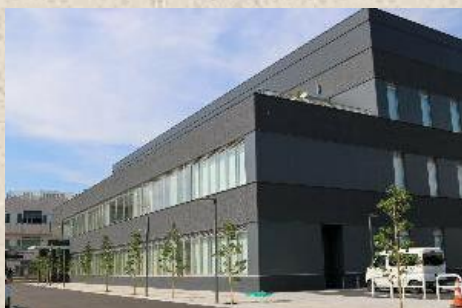
峰山庁舎2号館 京丹後市峰山町杉谷889番地