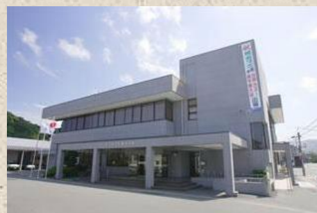
久美浜庁舎 京丹後市久美浜町814番地