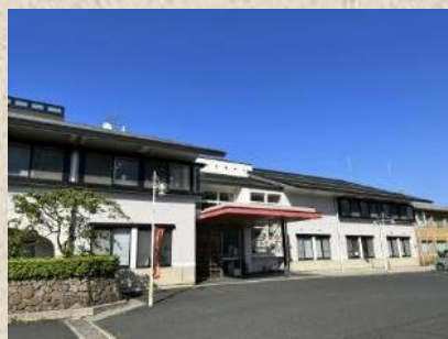
網野庁舎 京丹後市網野町網野385番地の1