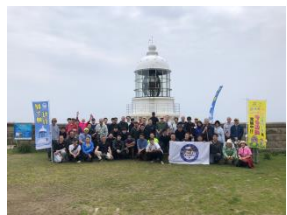
整備後、灯台前で集合写真

そんな丹後町のジオパークのスポットを舞台とした「丹後ジオEXPO」が5月・6月に開催されます。ぜひ足を運んでください!