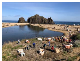
1トン土嚢袋約80個を回収