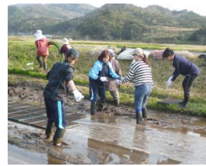
5/6 経ヶ岬灯台まつりで鯖カレーを販売