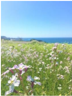
大成古墳群の浜大根