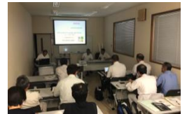
UI ターンも増加しているようです

8月26日(月)と27日(火)、丹後町区長連絡協議会は地域づくりの先進地で研修を実施。東広島市の小田地区と朝来市の与布土地区で自治体制の再編や地域経営、そして地域への熱い想いについて学びました。