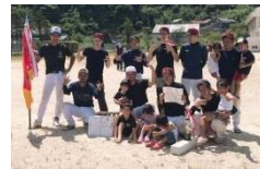
優勝チーム「ボンズ」

丹後町夏の風物詩、第74回盆野球大会(12チーム参加)。今年も熱く盛り上がりました。優勝はボンズ、準優勝は野蛮人でした。