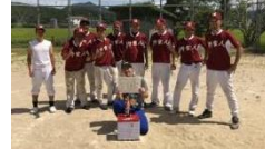
準優勝チーム「野蛮人」