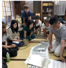
滞在中は海や星の綺麗さに大感動

また、豊栄では佛教大学の学生たちが地域の魅力の掘り起しを目的に3日間のフィールドワークを実施。今回は織物や観光を主にインタビュを行いました。学生たちは今後調査を続けながら映像にまとめ、11月に開催予定の豊栄文化祭でお披露目する予定です。