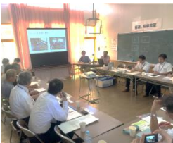
農水省を含む11団体が参加

8月7日(水)、宇川地域の振興を目的に活動をされている団体が集まり宇川の現状について意見交換を行いました。農林水産省の事業の一環で実施されたもので、課題解決に向けたICT導入が検討されています。