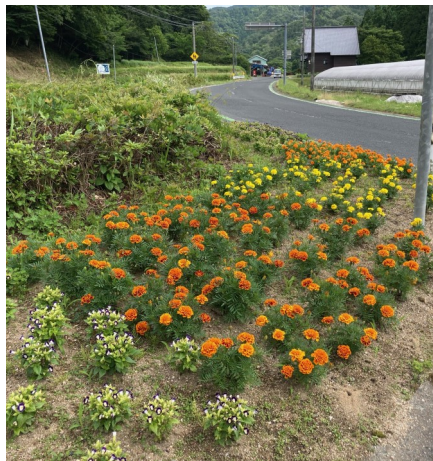
野中区内(野間花好会)