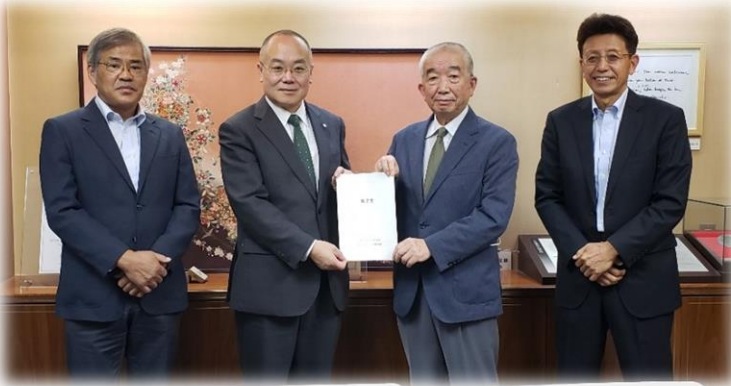
▲市長に提言書を手渡す友松会長(右から2人目)

にいっそう適切な空間となるよう、行政と市民が連携して取り組むこと」、「②丹後の地域資源の活用と地域活力の向上に資する場となるよう、多面的な検討を行うこと」を提言しました。