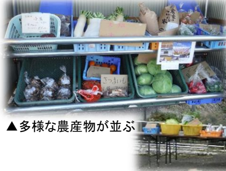
▲多様な農産物が並ぶ

現在、随時自家農作物を出荷いただける方を募集しています。詳しくは久美浜婦人センター（82-1146）へお問い合わせください。