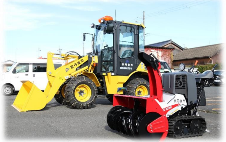
▲地区に貸与されるハンドドーザ（手前）及びホイールローダ（奥）

これにより、地区に貸与する除雪機械は、合計106台（乗用型59台、歩行型47台）となり、市内84地区の皆様を除雪作業をお世話になります。