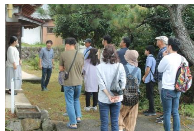
佐濃地区での移住者確保に向けたツアーの様子

指定を受けたことで、先行する町内他地区と同じく、川上地区でも移住者増加や空家・耕作放棄地の利活用を積極的に推進することで、更なる地域活性化へつなげる取組みを進めていきます。今後、指定地区での調査や協議を行うことがあると思いますが、皆様のご理解、ご協力をお願いします。