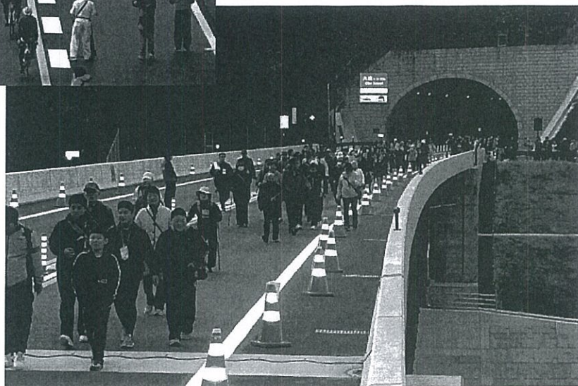
浜坂ロードウォーク（香美町） ：平成29年11月11日