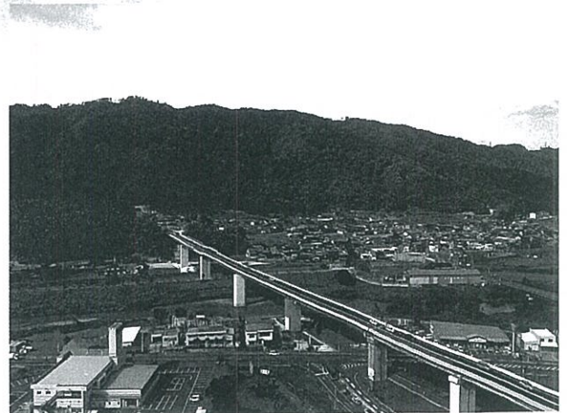
野田川大宮道路 [京都府]