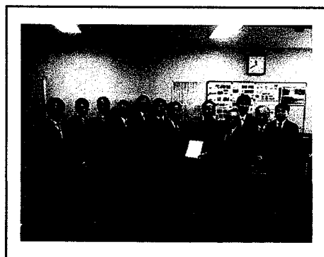
国土交通省近畿地方整備局