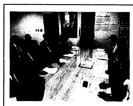
京都府建設交通部