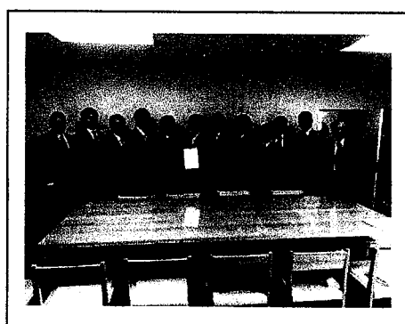
京都府建設交通部