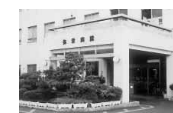
あつてはならない贈収賄事件

は市立の診療所との関係はどうなっているのか。 医療事業部長 かなりの数の、医療機器なり診療材料が入ったと聞いている。久美浜病院には他の業者も入っている。