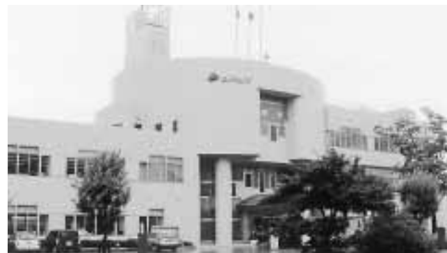
信頼を高める市政を