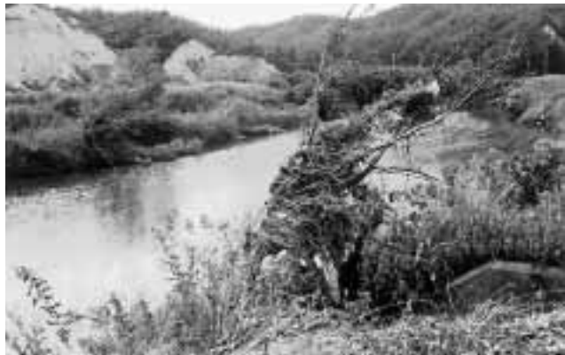
台風23号のゴミ（竹野川）

に調理室にクーラーが設置されていない保育所もあり、非常に暑く、食品衛生管理の面からも問題がないのか。 保健福祉部長 調理室のクーラーについても、網野、丹後は全て設置されており、久美浜でも一部設置済み、残りの町は設置されていないが、児童の安全のためにもクーラー設備は、計画的に順次整備を進めたい。