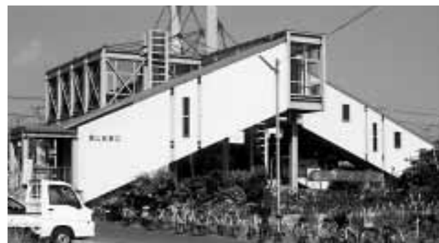
整備を待つ峰山駅東口

尼崎市のJR福知山線脱線事故の教訓は。市長 安全の確保は何よりも優先。自らの事として受け止め、原因究明の徹底と共に教訓を今後に生かして行く。