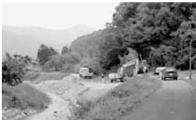
頑張ってやっている台風23号の復旧工事

問 地域防災計画案の市民への事前公表は。 市長 防災協議会で策定された計画案を4月に区長に提示して、災害対策を説明した。出た意見を反映させて、今は京都府と事前協議中です。