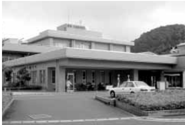
多機能で特色ある病院を

師派遣体制を構築するため、京都府や大学病院等との連携や折衝は現在も積極的に行っている。 問 特色ある病院について 市長 市立病院だからこそできる、特色ある病院をめぐり、発想転換しては。例えば、保育所との連携で病児保育とか、予防医学の観点から健康づくり教室とか。 市長 貴重な提言と受け止めて検討してみたい。