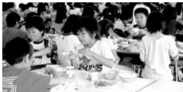
安心安全な給食を

食生活の乱れによる、栄養バランスの崩れと外食化が進む今、食育の必要性を痛感するが。