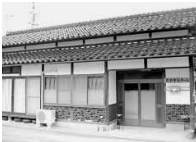
民家を改築した障害者グループホーム

を体系的に網羅した指針や条例がないため、住民や業者との間にトラブルが発生する。環境先進地を目指すためには環境基本条例を制定する必要があると思うがどうか。 市長 国や府においても環境基本条例が制定されている。今後検討をしていく課題である。