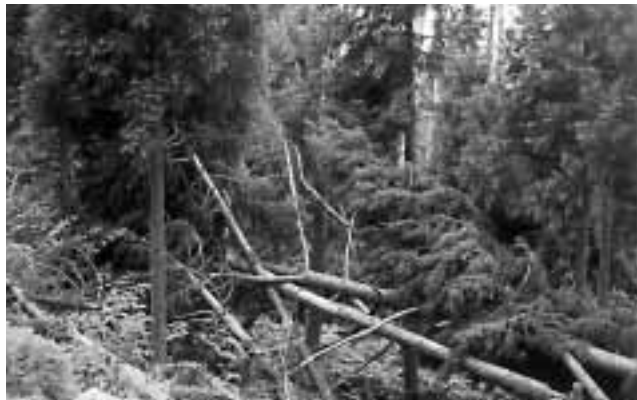
何時になったら出来る森林災害復旧

問 昨年の秋、甚大なる災害をもたらした台風23号による被害は、家屋をはじめ、道路、河川、農業用施設、水産施設、森林と、広い範囲において発生した。その後、市の対応やボランティアの方々による協力