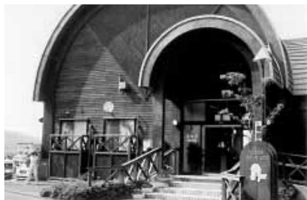
公設民営の碓高原ステーキハウス