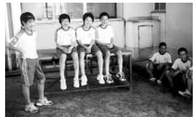
安全性が問われる、中学生の中国派遣