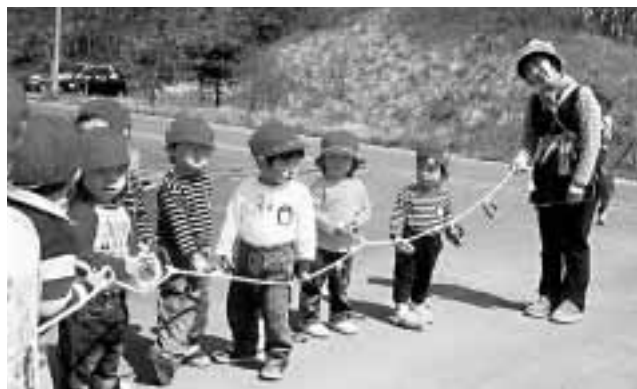
子供は宝 職員もご苦労さま

問 網の整備について。 市長 北近畿広域観光連盟・広域キャンペーン等での連携、総合審議会に与謝・豊岡市からも来ていただく。道路期成会もありようも含めて広域的に検討させていただきます。