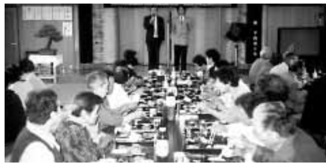
健康でなごやかな雰囲気に包まれた敬老会

小学校区に複数館が設置されている網野町の3校区・計10館の再編について協議している。