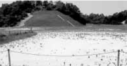
どうなる納豆工場誘致

問 現状の開放市長室に加え、地域に向き懇談会を行うてはどうか。 市長 さらに地域を知るため、有益であるので検討する。