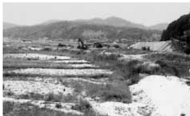
堤防決壊 手つかずの水田

問 網の整備について。 市長 北近畿広域観光連盟・広域キャンペーン等での連携、総合審議会に与謝・豊岡市からも来ていただく。道路期成会もありようも含めて広域的に検討させていただきます。