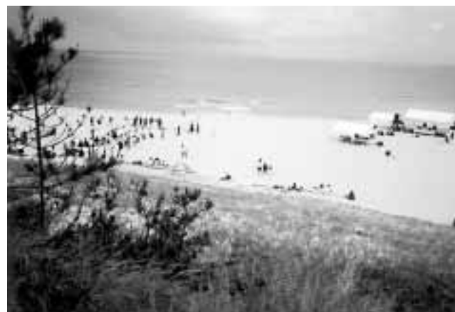
地域の活性化につながるイベントを！（網野町琴引浜）