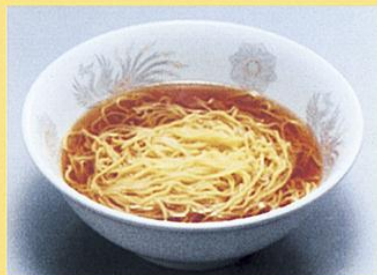
麺の食塩量は0.3g (スープ220cc)