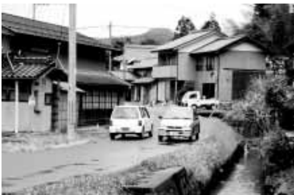
ご意見のあった市道永留一分線。軽自動車同士のすれ違いでも徐行が必要

しかし、道路改良の全体計画において、残り区間については、道路新設予定地上の二軒の家屋と一軒の工場を移転させることとなっておりますが、現在のところ移転先が見つかっていません。移転先が見つからない場合は、道路設計速度を落として別の場所に道路を設置するか、また、技術的にそのような変更が可能なの