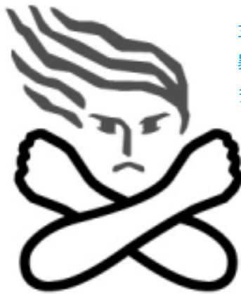
女性に対する 暴力根絶のための シンボルマーク

さらに、従来に殴る、蹴るといったような「身体に対する暴力」のほか、今回の改正により「身体に対する暴力に準ずる心身に有害な影響を及ぼす言動」も含めることになりました。