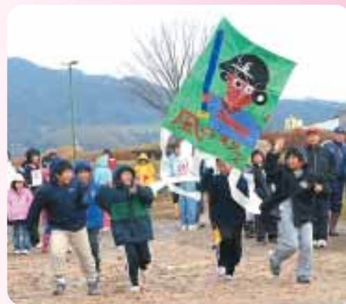
寒さも忘れ全力疾走

年の始まりを告げる恒例の「新春たこあげ大会」(弥栄町青少年をそだてる会主催)が、一月八日に水辺公園やさか野で開かれ、弥栄町内の小・中学生百八人が、歓声を上げながら手づくりの「たこ」を大空へ舞い上がらせた。