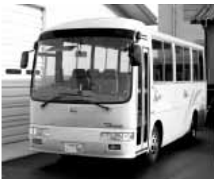
活用が期待される、市所有のマイクロバス

旧町から引き継いだ市所有のバスは三台です。本市所有のマイクロバスについては、車両維持管理上の問題や、「自家用自動車」を有償で運送の用に供してはならない」という道路運送法の規定を踏まえて、運行の用途は、現在、市が行う事業または社会教育団体な