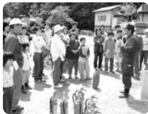
市役所職員が現場に出向き市の事業や施策についてご説明するとともに、意見交換を行う「まちづくり出前講座」

市民のみなさんが気がねなく気軽に声を発していただけるように、要請があれば市役所職員が現場に出向き、市の事業や施策についてご説明するとともに、意見交換を行います。