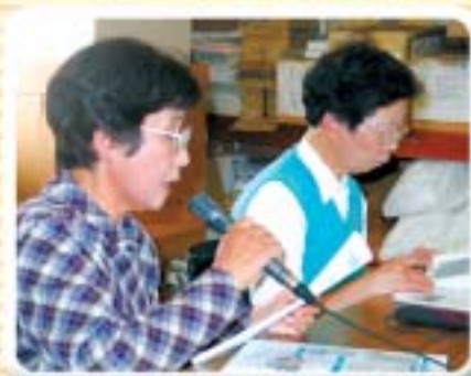
朗読ボランティア ウグイス会 (峰山町)