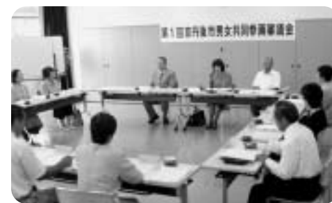
審議会などの委員を公募するとともに、半数は女性を基本として選任

審議会などの委員を公募するとともに、各層のご意見を施策に反映するため、あらゆる年代から、また男女共同参画の推進の観点からも委員の半数は女性を基本として選任しています。