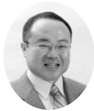
京丹後市長 中山 泰

京丹後市も、合併・誕生して三年が経過し、四年目の春を迎えつつあります。六つの町が一つになつたわけですが、福祉や産業、道路などの社会資本、教育はじめ人づくり、防災、医療などの安心安全の確保など、まだまだ課題が多いのが現状です。行政も京丹後市の基盤づくり、