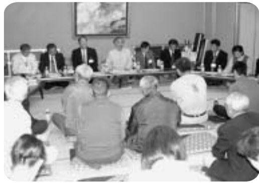
市民局長主催による「市民懇談会」を各町で開催

「市政懇談会」に加え、新たに平成十八年度から、すべての市民局において、市民局長主催による「市民懇談会」を開催。より市民のみなさんとの交流を活性化し、「協働と共創」のまちづくりを図っています。