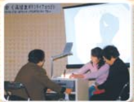
要約筆記サークル うみなり (久美浜町)