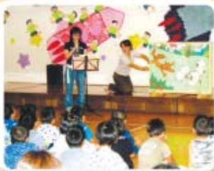
虹色のたね (弥栄町)