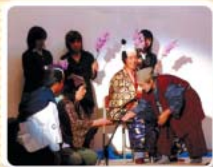
つくしんぼ (丹後町)