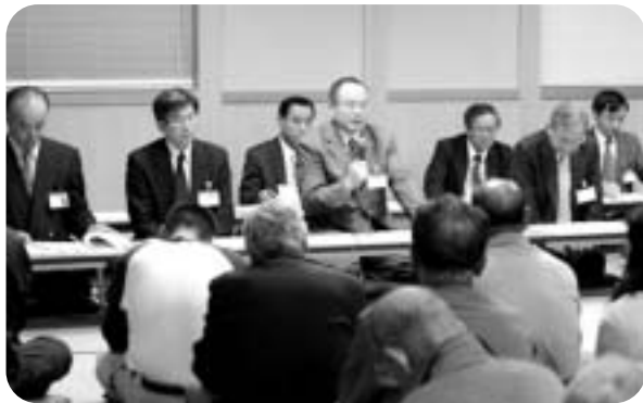
市長自らが住民のみなさんの居地に出向き、ご意見やご提案などをうかがう「市政懇談会」

「協働」によるまちづくりを推進するため、市長自らが住民のみなさんの居地に出向き、直接市民のみなさんと意見交換を行い、ご意見やご提案などを市政に反映してまいります。