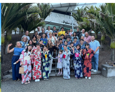
ホストファミリーとの様子