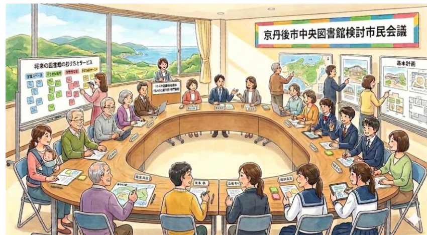
※イメージ図はAIで作成しました。