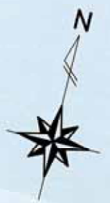
京丹後市生活排水処理計画区域図 S=1:100,000