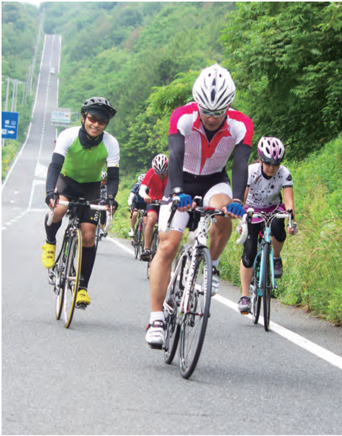
▲自然の中でサイクリングを楽しむ参加者たち

京都府や地元自治体などで構成する同実行委員会が主催する府内最大級のサイクリングイベント。天橋立駐車場を発着点とし、中丹・丹後地域を巡るAコース（190キロ）と丹後半島を一周するBコース（100キロ）の2種類のコースが設けられ、愛好家たちがそれぞれのペースでゴールを目指しました。 コース上には、各市町に1カ所ずつエイドステーション（休憩所）が設置され、特産品などを使った補給食を提供。丹後町の道の駅「てんきてんき丹後」では、スタッフたちが「ぼらずし」の振る舞いなどで参加者をもてなしました。 大阪府高槻市のグループ「クラブTRAP」は、昨年に引き続き2回目の出場。メンバーたちは「食べ物はおいしいし、景色も最高です」と話し、沿道の声援に応えながらゴールを目指していました。