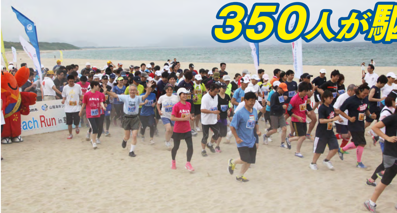
▲砂の感触を楽しみながら一斉にスタート(10*、5*コース)

「第1回サンセットビーチラン in 京丹後」が6月28日の夕刻、網野町の夕日ヶ浦海岸で開かれ、参加者がレースや交流イベントなどを通して京丹後の美しい浜辺の魅力を満喫しました。