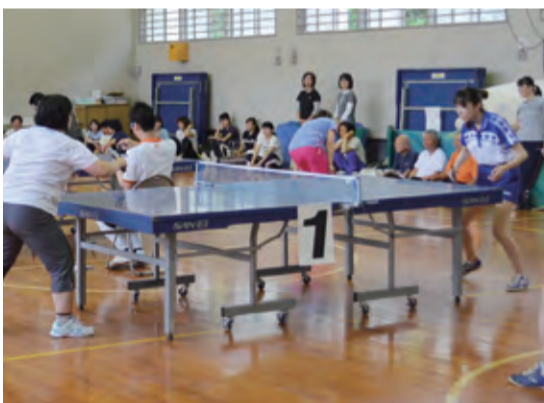
▲峰山スポーツ祭典(卓球)