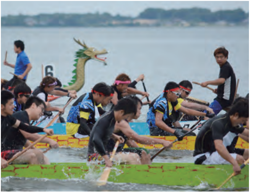
▲一心にパドルを漕ぎ競う参加者たち