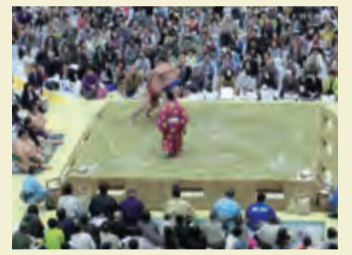
▲迫力ある取組(4月1日、大相撲京都場所)

観覧席は1,532席あり、1,730人が観覧できます。会場は小さいのでどの席からも迫力ある取組を見ることができでしょう。商業目的以外なら、自分の席からの写真・ビデオ撮影ができます。座席の方角は正面、向正面、西、東の4種類あり、東方力士は向正面東側から、西方力士は向正面西側から入場します。ちなみに、向正面は取組で行司が立っている側で、大相撲のテレビ中継は正面から撮影しています。イス席以外は座布団に座っての観覧となります。なお、この座布団はイス席の方を含めた観覧者全員に記念品として配られますし、幕内、十両力士を写真付きで紹介したパンフレットも全員に無料で配布されますのでお楽しみに。