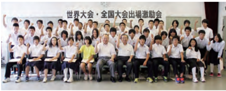
▲7月23日に行われた世界大会・全国大会出場激励会の様子