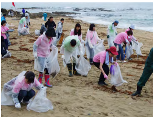
▲漂着ごみを拾い集めるボランティア(久美浜町・箱石海岸)