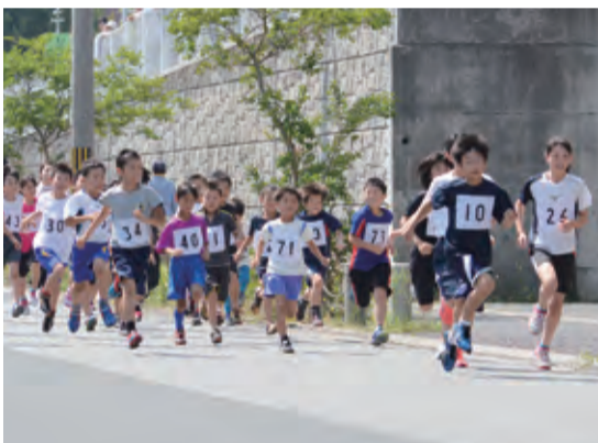
▲大宮町体育大会(ロードレース競技)