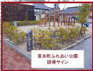
東本町ふれあい公園 誘導サイン