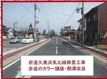
府道久美浜気比線修景工事 歩道のカラー舗装・側溝改良