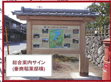
総合案内サイン (豪商稲葉邸横)