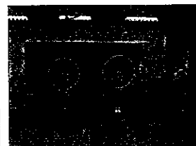
発表会4歳児『フープ演技』