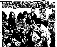
スイミングのコーチのプール指導