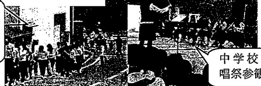
中学校の合唱祭参観