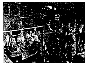
いか干し大根づくり