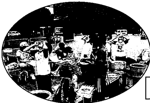
ふるさと再発見 未来塾