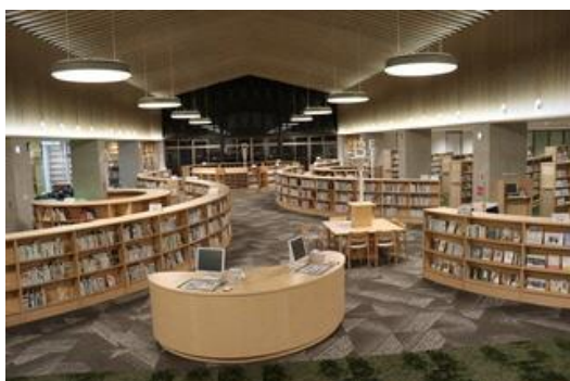
(一般開架スペース)