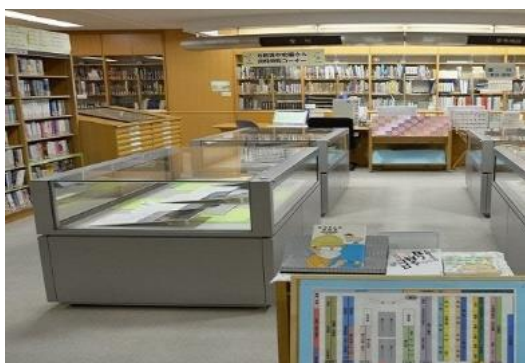
(郷土資料スペース)