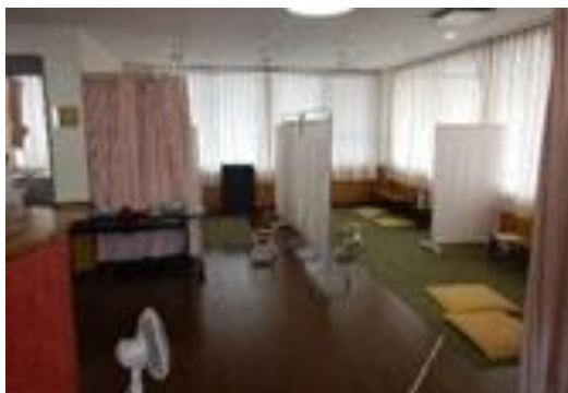
(保健センター機能)