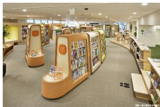
(児童書・絵本スペース)