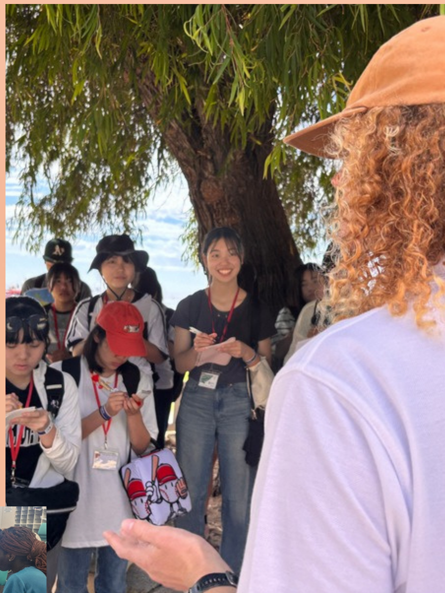
ロットネスト島でSDGsの探究活動

令和8年度の海外派遣事業に関心を持つ生徒や保護者、グローバル人材育成に興味をお持ちの方々など、どなたでも参加可能ですので、お気軽にご参加ください。