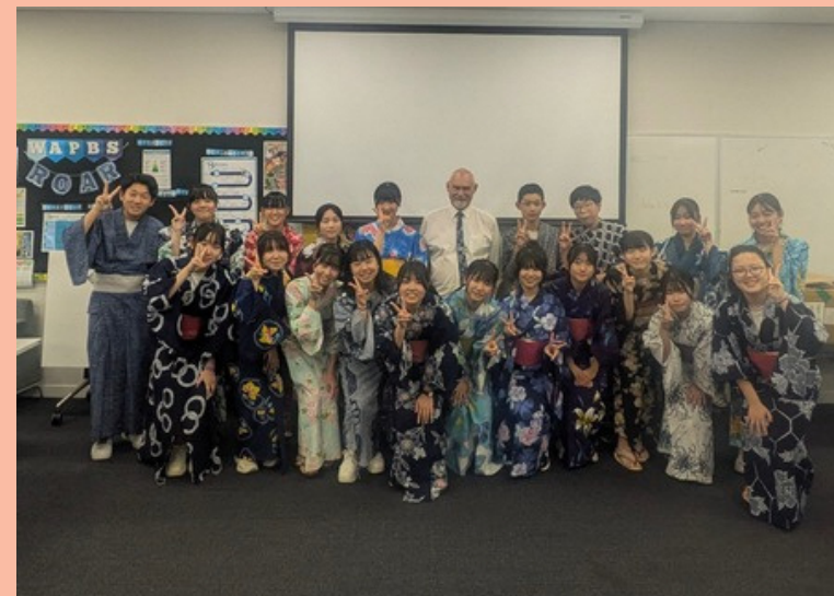
フェアウェルパーティー