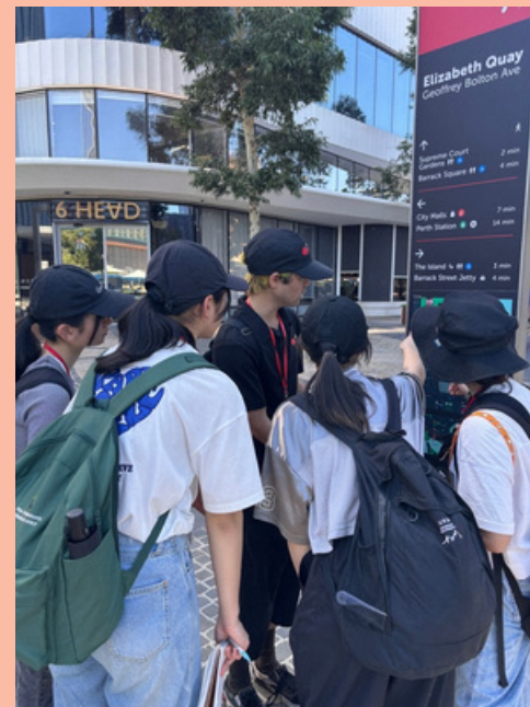
パース市内での フィールドワーク