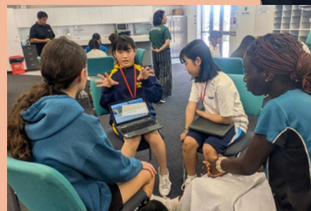
現地校でプレゼンテーション