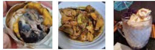
Balut バルット Adobo アドボ Halo Halo ハローハロー

Lots of traditional foods 伝統的な食べ物がたくさんある