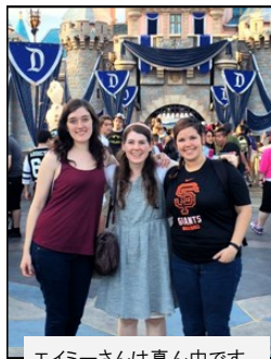
エイミーさんは真ん中です。

京丹後市には多くの広々とした空間と美しい自然があります。私の出身地は、魅力的な建物や博物館がたくさんありますが、私は今、京丹後市で自然に囲まれてうれしいです。