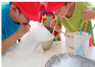
ストローで吹いたらいっぱい泡がでてきたよ。