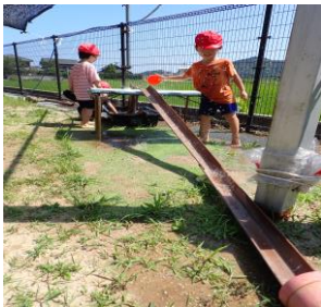
雨どいに傾斜をつけての水流し。

夏の遊びと言えば…。プールではありません。子ども達は自分の好きな遊びを見つけて思い切り楽しんでいきます。